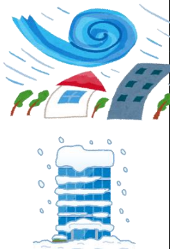
風・雹・雪災、水災による損害共済金の推移

平成26年豪雪による雪災、平成30年7月豪雨による水災、平成30年台風21号及び台風24号による風災といった様々な自然災害が発生し、共済金の支払いが増加していることから、共済掛金率を改定しました。